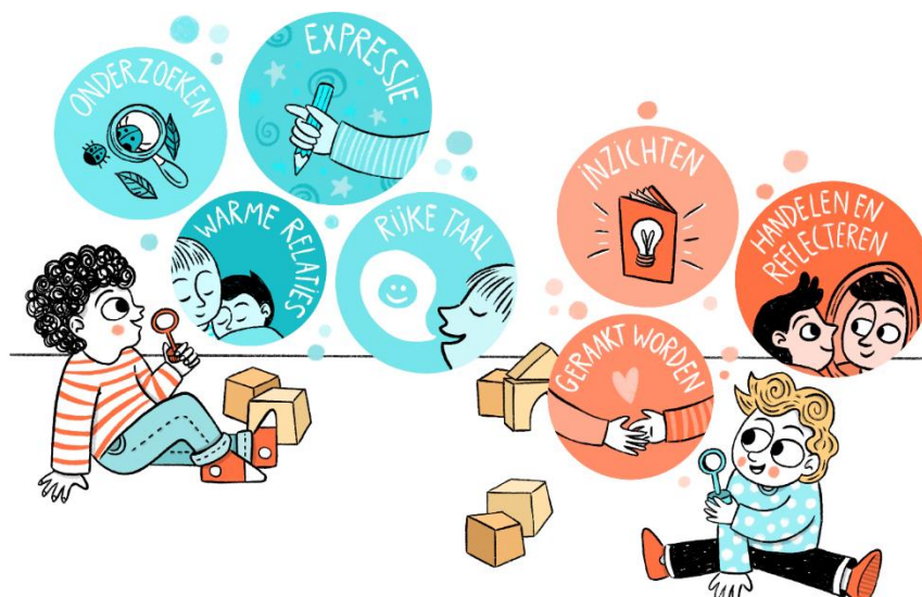
Fig.2 de zeven hefboomen in het streven naar gelijke groei- en leerkansen (zie TRACKS' conceptnota voor meer details) 3

Het kernthema 'kwaliteitsvolle interacties' richt zich op de relatie tussen professional en kinderen. Dit impliceert een verdere stap naar het metaniveau: 'hoe zien we onszelf als een professional, hoe kijken we naar ons eigen referentiekader?' 'Hoe leer je er kritisch over te reflecteren, hoe leren we onze acties af te stemmen op ervaringen en inzichten in termen van kwetsbaarheid, achterstandssituaties en kinderarmoede?' In dit verband zijn de drie hieronder genoemde hefboomen van cruciaal belang en 'voltooiën de hele cirkel' door te focussen op percepties, kennis, inzichten en praktijk van professionals: